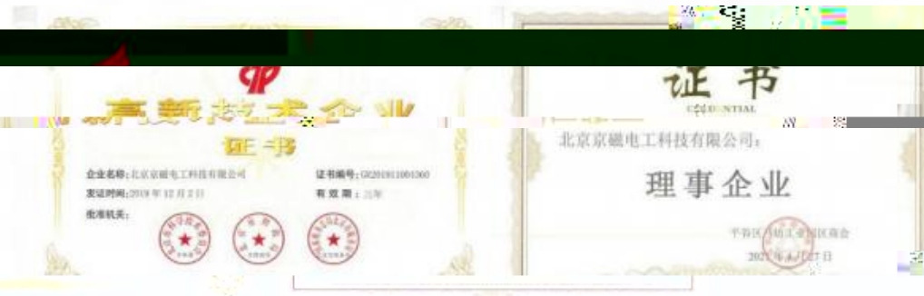
图 1 企业获得的部分荣誉资质

力于环境保护，利用一切合理资源，达成顾客愿景”为经营方针，定位于中、高端烧结钕铁硼永磁材料国际主流市场，持续为全世界各地的顾客提供性能可靠、质量优秀的产品，以及高效、专业的服务，赢得了良好的市场信誉和顾客信任。目前代表性客户有西门子、法雷奥、歌尔股份、丰达电机、美的集团等。